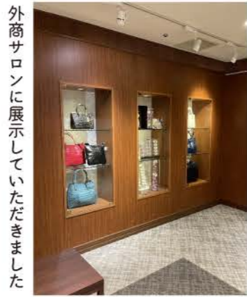
外商サロンに展示していただきました