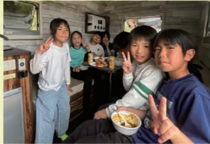
こちらの貸切エリアにはトレーラーが設置しており、冷暖房完備。子供たちは隠れ家のような部屋に大喜び♪