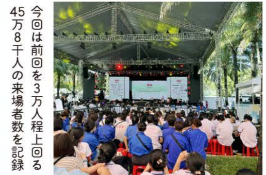
今回は前回は 3 万人程上回る 45 万 8 千人の来場者数を記録

本フェスティバルは、 日本とベトナムの文化・ 経済交流促進を目的とし た、ベトナム最大級の日 越交流イベントです。政 府・企業・大学が参加す る官民一体のプロジェクト として、多様な交流プ ログラムを実施し、日越 間の関心の高まりとイベ ントの充実が広く支持さ れています。