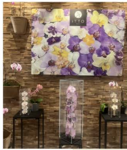
ご来店の際は、ぜひ撮影スポット としてもお楽しみください

表参道店では、店内ディスプレイをリ ニューアルいたしました。 カラフルな生花とドライフラワー商品を 組み合わせることで、華やかで 目を引く空間に仕上げています。 さらに、壁面には大型パネルを設置 し、写真映えするスポットとしてお楽し みいただけるよう工夫いたしました。 床にはラグを敷き、より空間としての一 体感と居心地の良さも演出しています。