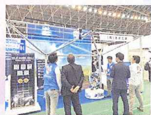
【びわ湖ビジネスメッセ 2018】 出展の様子

【びわ湖ビジネスメッセ 2019】は「環境と経済の両立」を基本理念に持続可能な 経済社会を目指し、環境産業の育成振興を図るため、環境負荷を低減する製品・ 技術・サービス等を対象とした、商談・取引と情報発信・交流の場となる環境 産業の総合見本市です(びわ湖ビジネスメッセ開催概要より抜粋)。 今回の出展企業・団体は300を予定されています!!本郷工業の展示ブースは【B -16】に御座いますので、お立ち寄りいただけますと幸いです。アクセス方法や詳細 情報については びわ湖メッセ とインターネット検索いた だくとサイトから確認できます。また、弊社までお問い合わせ いただきましたらご案内も可能です(*^_^*)