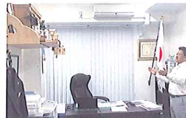
本部長室での日課

しかし、大変ではありますが、私自身も新たなステージで成長できるチャンスなので期待に応えていきたいと思っています。まずは「みんなが当たり前前」のことに当たり前にできるような「ことを目指して、一歩一歩、自分も周りも成長できるように頑張ります。」