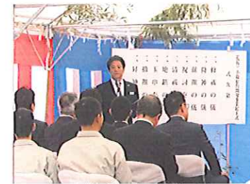
もっとも印象に残った受注工事 「(仮称)小椋原台開発事業」起工式にて

毎晩社長らと相談してはいたのですが、その中で「目先の利益だけを追うのはやめよう」と話し合っていました。これだけ大きな開発事業なのだから本郷ブランドを湖東地域のお客様に広く知ってもらえる大きなチャンスになる。必ず受注を勝ち取って弊社の看板商品にしていこう！とギリギリまで努力を重ねました。こうした未来を見据えた強い気持ちで受注成功につながったのだと思います。」