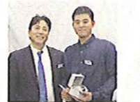
12月に行われた感謝祭で新成人のお祝い授与