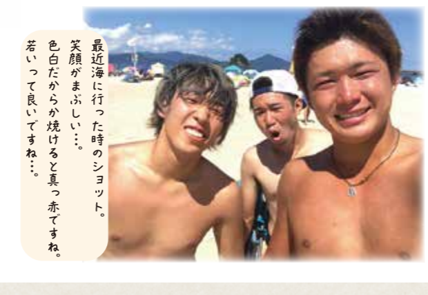
最近海に行った時のショット。 笑顔がまぶしい...。 色白だから焼けると真っ赤ですね。 若いつて良いですね...